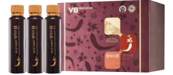
예진생 진생베리® 명작수 천삼화 홍삼과 진생베리®(부원료)를 고스란히 담은 고농축 앰플 20g×45앰플/23만원