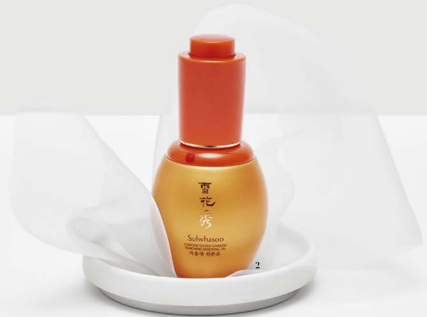
자여진에센스의 주름을 탄력으로 차올리는 원리

피부가 쉽게 건조하고 거칠어지는 겨울철에는 피부 본연의 힘을 길러주는 것이 급선무다. 설화수 자여진에센스, 자음생진본유로 혹독한 외부 환경에도 흔들리지 않는 촉촉하고 탄탄한 피부로 관리하자. 자여진에센스는 피부 속 탄성막이 무너지면서 생성된 잔주름과, 잔주름들이 만나 형성되는 깊은 주름 등을 인삼 캡슐이 케어해 팽팽하고 매끄러워진 피부로 가꾸어준다. 자여진에센스를 바른 후에는 자음생진본유로 피부 보호막을 씌워 피부 본연의 힘을 키워준다.