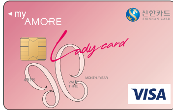
신한 마이아모레 제휴카드 아름다움을 추구하는 스마트한 당신께,

똑똑함과 아름다움을 겸비한 소비자라면 마이아모레 신한카드에 대한 지식은 필수다. 마이아모레 신한카드는 당신에게 차원이 다른 혜택을 선사한다.